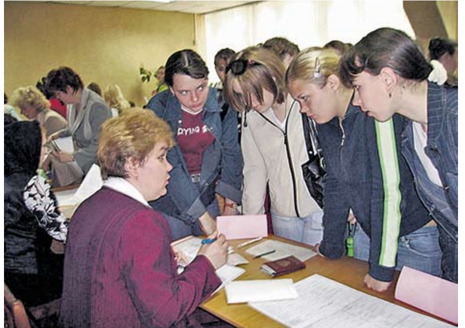
Молодь активно шукає роботу на ярмарках вакансій

У центрі уваги традиційної апаратної наради у Будинку спілок були проведена Рада ФПУ, підготовка до з'їзду організації, аналіз низки запропонованих урядових новацій, судові розгляди справ за участі профспілок, розглянути питання безпеки охорони праці, співпраця з міжнародними організаціями. Про головні моменти обговорення – докладніше.