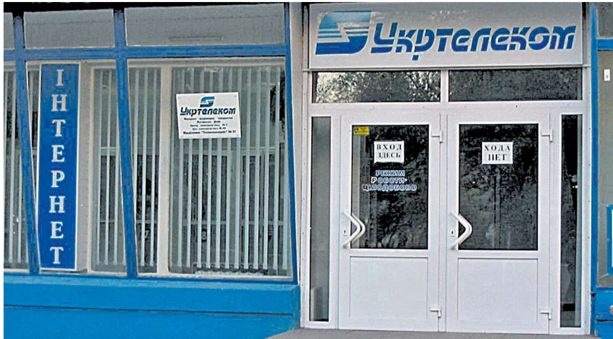
«Укртелеком» буде найбільш ласим шматком наступної черги приватизації