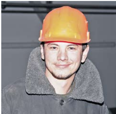
На заводі немає профспілки. Це – виклик для профільних членських організацій ФПУ.