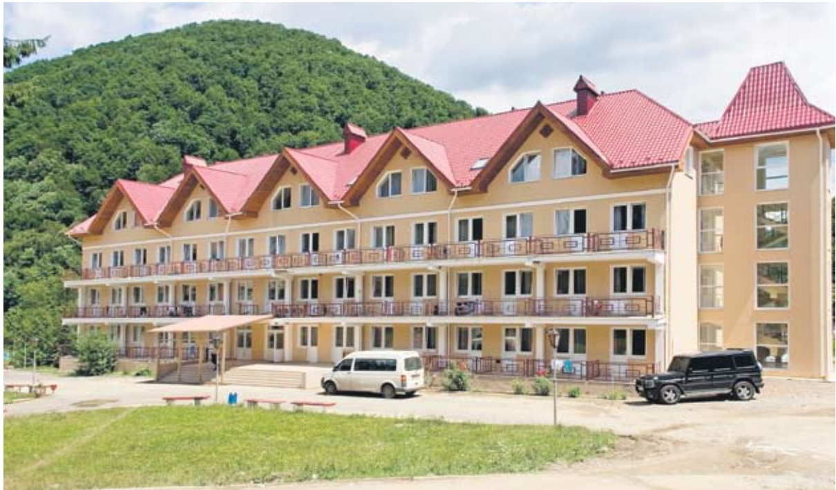
Не кожен працівник може дозволити собі викласти із сімейного бюджету близько 1500 грн на оздоровлення