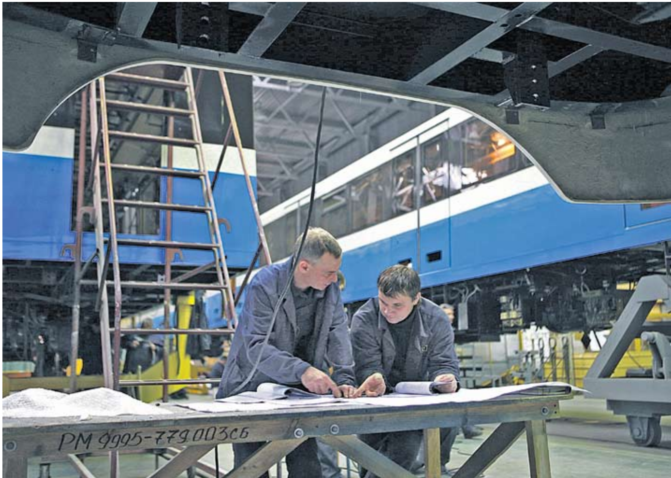
На КВБЗ одночасно випускають до шести моделей вагонів