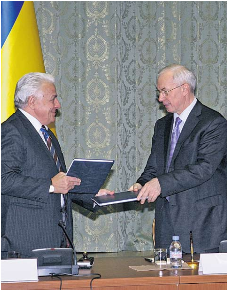
Голова ФПУ Василь Хара та Прем'єр-міністр Микола Азаров під час підписання Генеральної угоди на 2010–2012 рр.

законопроектів пройшли експертизу ФПУ за період із 2006 по 2010 роки. А також представники ФПУ у НТСЕР розглянули 1554 листи і звернення, провели 88 консультацій, нарад і робочих зустрічей, понад 60 конференцій, круглих столів та семінарів.