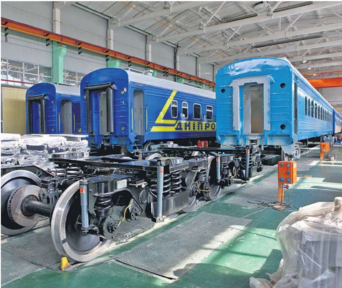
На передньому плані – крюківське ноу-хау: візок, що розвиває швидкість 160–200 км/год

Щоб хлопець чи дівчина не загубилися у 8-тисячному колективі, на заводі створено відділ роботи з молоддю. Молодіжні лідери зустрічають майже на порозі заводу – допомагають адаптуватися, у кар'єрному зростанні, залучають до участі в конкурсах, спортивних змаганнях, добровільних акціях. Як результат, нині на заводі молодь до 35 років становить 45%. Єдине, що не може вирішити для свого «майбутнього» КВБЗ, – житло. Трьох гуртожитків хронічно не вистачає.