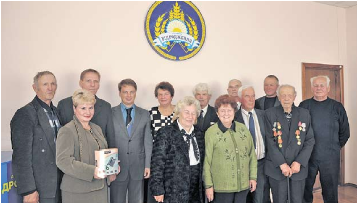
Адміністрація та профспілковий комітет ТОВ «Відродження» дають про ветеранів праці та пенсіонерів