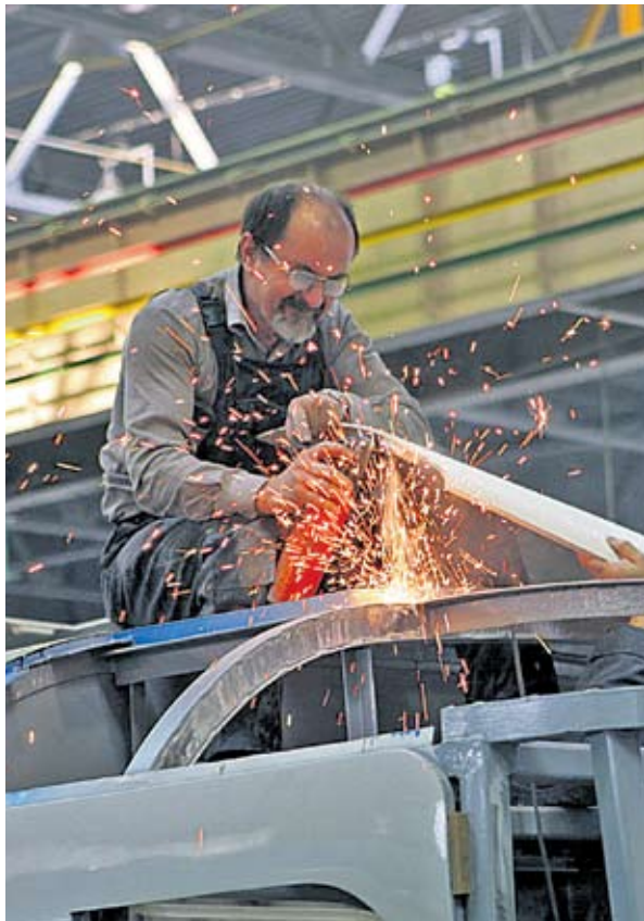
Робітник високої кваліфікації може одержати до 10 000 гривень