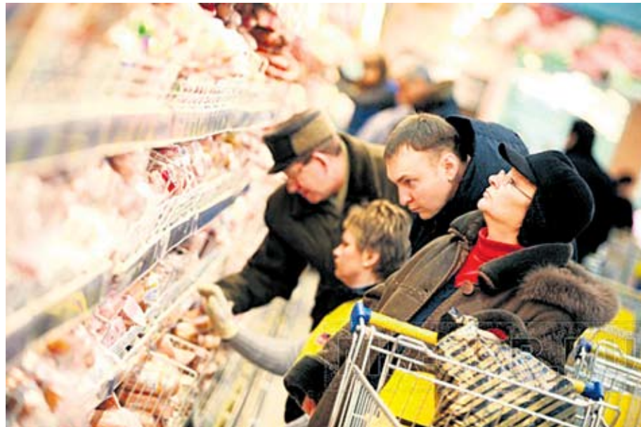
Підробний товар розраховано на невибагливого споживача з низькою платоспроможністю

Продуктів харчування на споживчому ринку стає дедалі більше, та натуральна продукція швидко витісняється дешевими підробками, небезпечними для здоров'я та життя.