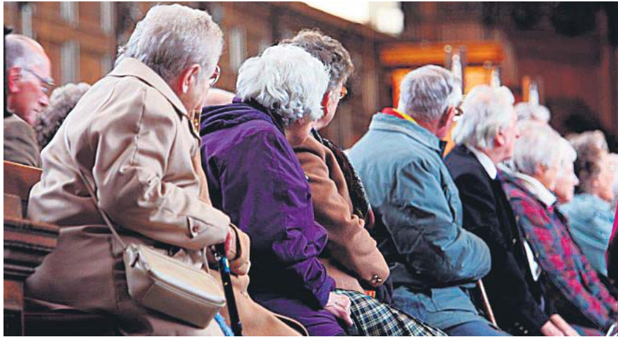
Пенсіонери чекають, коли держава повернеться до них обличчям