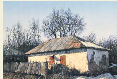
Народились, вирости, пішли. 2007