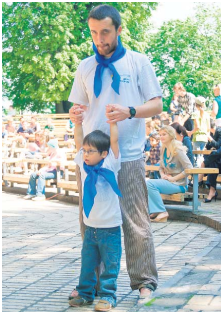
"Сонячний" Льова зі своїм старшим братом