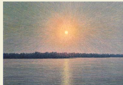
Зійшло сонце над Дніпром. 2004