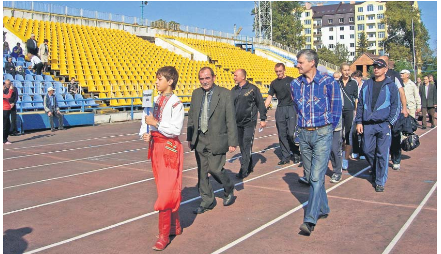
Освітняни Виноградівщини на параді відкриття галузевої спартакіади