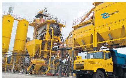
Асфальтозмішувальна установка. По суті — завод

Звісно, повз завод не пройшло жодне з економічних потрясінь. У 90-ті працівники мітингували проти затримання зарплати (підприємство тоді виживало за рахунок закритих заводів для консервації), під час кризи перебивалися разовими замовленнями в умовах скороченого робочого дня, але при цьому «Кредмаш» був серед небагатьох, завдяки чому Фонд із безробіття виплачував заводчанам допомогу. Сьогодні тижневе завантаження заводу коливаться між 4 і 5 робочими днями, тому що залежить від замовлень, яких поки що замало. Пов'язано це із загальною економічною ситуацією (перед кризою завод замовляв по 100–120 асфальтозмішувальних установок на рік, торік — лише 60) і сезонністю — взимку шляховики замовляють більше техніки, щоб із першим теплом розпочати роботу, а отже, завод лише входить у період робочого піку. Нині в цехах виконують заявки обладотворів Донецької, Сумської та Полтавської областей на піскорозкидальні й поливомийні машини. Проте основними споживачами були й залишилися не Україна, а Росія, Білорусь і Казахстан. Із жовтня перебувають у дорозі на Курильські острови дві асфальтозмішувальні установки (читай, асфальтові заводи). Кремдмашівці зуміли одержати це замовлення, витримавши конкуренцію щодо співвідношення ціни та якості з японцями й китайцями.