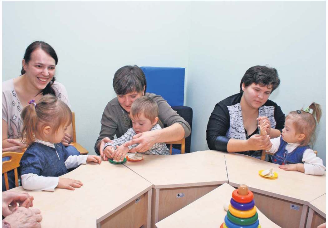
Для дітей із синдромом Дауна дуже важливо розвивати дрібну моторику. А якщо поруч мама і найкращі друзі – успіх гарантовано!

Давно доведено, що дитина із синдромом Дауна може народитися у будь-якій сім'ї. Генетики стверджують, що вірогідність народження такого малюка не залежить ані від здоров'я, ані від способу життя чи шкідливих звичок його батьків. При цьому батько й мати мають нормальний набір хромосом. Спеціаліст-генетик може з високою точністю визначити наявність синдрому Дауна у дитини за зовнішніми ознаками. Тому переважна більшість батьків дізнаються про це ще в пологовому будинку. Кілька років тому від дітей із синдромом Дауна відмовлялися 80 відсотків батьків. Нині все більше дітей залишається у родині. Малюки із синдромом Дауна проходять такі ж етапи розвитку, як і решта дітей, але дещо повільніше, із затримкою. Фахівці-генетики переконують, що саме від батьків залежить розвиток такої дитини. Завдяки розвивальним заняттям відставання в інтелектуальному й фізичному розвитку можна звести до мінімуму.